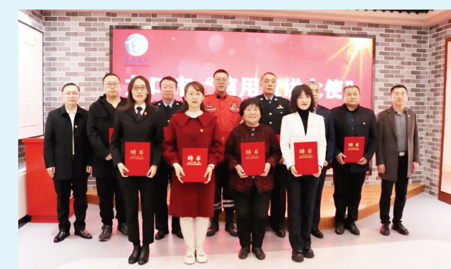
龙口市聘任“信用宣讲大使”。