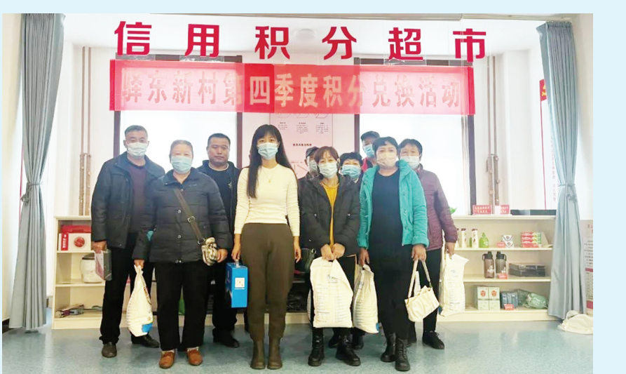
居民用信用积分在“信用超市”兑换生活用品。

大力实施“四十百千”亮点工程建设，推进“诚信示范片”“诚信示范街区”“诚信示范村居(社区)”创建，搭建全市农村信用信息系统，结合网格化工作，常态化开展