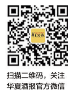
扫描二维码, 关注 华夏酒报官方微信