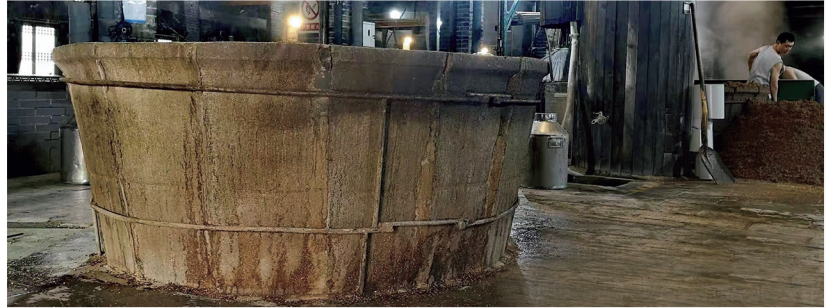
邯郸张氏望族始创贞元增烧坊于明弘治八年