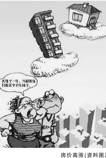
房价高涨(资料图片)

●使用当天:器官微微发热,勃起度满意,硬度加强,夫妻生活时间延长2-3倍。●使用1盒:器官增长,硬度增强,持续控制时间大大延长,夫妻生活质量明显提高。●使用2盒:器官明显增长,增大到您满意的效果,生活质量完全改善。忠告:本品100%纯埃及金壁虎提取液(A型玛卡芮),其活性是普通增长液的数十倍,因此请您效到即停,以免超出常规尺寸,影响正常生活。超大容量、只需2盒 7天无效退货。即日起购买征换增长延时液(外用),买2盒赠2盒原装进口征换胶囊。