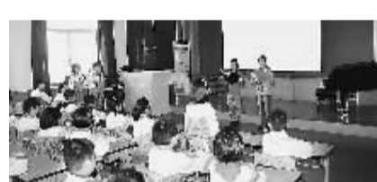
近日,养正小学开展“争做四有少年”主题中队会。