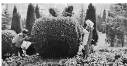
昨天上午,莱山区园林工人在港城大街绿化带栽植苹果造型的花卉雕塑。