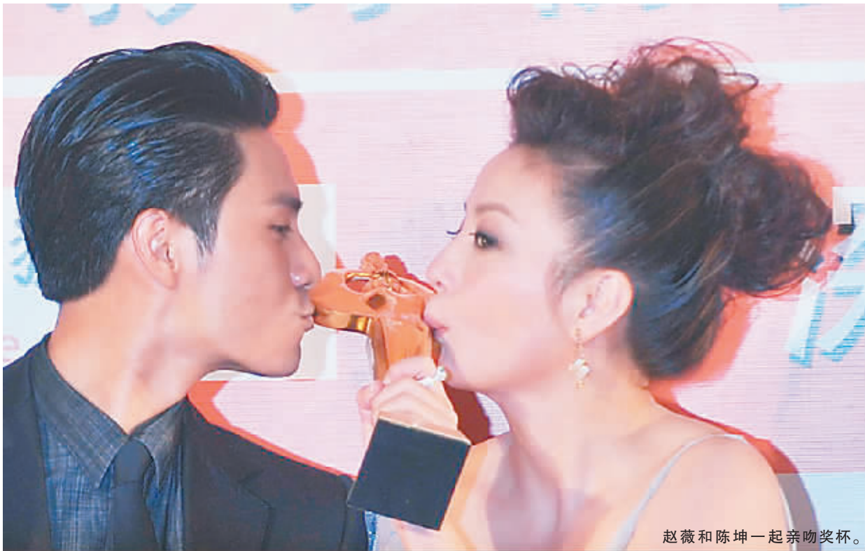
赵薇和陈坤一起亲吻奖杯。

10月16日晚,第19届金鸡百花电影节闭幕式暨第30届大众电影百花奖颁奖典礼在江阴市■山湾国际会展中心举行。《建国大业》获得最佳故事片奖,《花木兰》《惊天动地》获得最受欢迎故事片奖,赵薇、陈坤分别获得影帝影后桂冠,冯小刚则凭借《非诚勿扰》获得了金鸡百花电影节的三连冠,苏有朋获得最佳男配角奖,最佳女配角由王嘉、许晴并列获得,最佳新人奖归属徐箭,于洋、田华获终身成就奖。据悉,下届主办城市确定为安徽省合肥市。