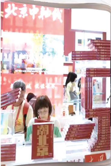
↑观众在第三十一届北京国际图书博览会翻阅图书。

翻开这份沉甸甸的荣誉榜单，一幅中国出版业扎根时代、仰望星空、拥抱生活的生动画卷跃然纸上。