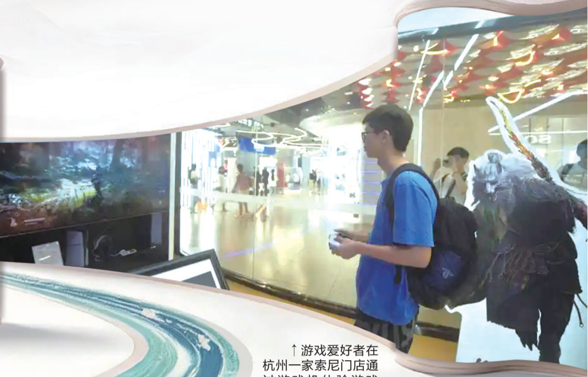
↑游戏爱好者在杭州一家索尼门店通过游戏机体验游戏《黑神话：悟空》。