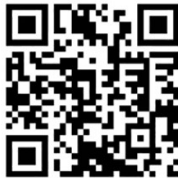
扫描二维码下载报名表

需要注意的是,此次优惠政策仅限人才本人申领使用,若发现通过弄虚作假手段申领的情况,将立即取消其政策享受资格。