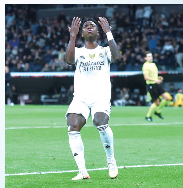
皇马球员维尼休斯仰天长叹

新华社马德里12月7日电 在2025-2026赛季西班牙足球甲级联赛7日的比赛中,皇家马德里主场“翻车”,0:2不敌塞尔塔,被巴塞罗那在积分榜上甩开距离。