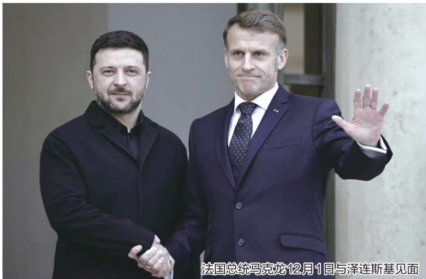
法国总统马克龙12月1日与泽连斯基见面

备受瞩目的俄乌“和平计划”近日通过美国、乌克兰等多方接触及相关会谈、磋商加速推进。