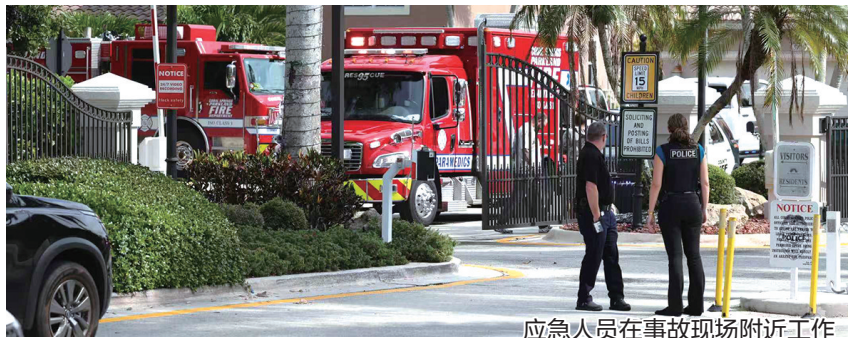
应急人员在事故现场附近工作

美国地方官员10日证实,一架前往牙买加执行飓风救灾任务的小飞机在佛罗里达州海滨城市劳德代尔堡郊外的珊瑚泉市坠毁,造成两人死亡。