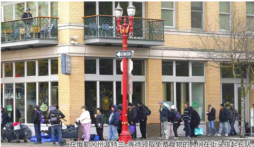
在俄勒冈州波特兰,等待领取免费食物的人们在街头排起长队。

美国联邦政府5日进入“停摆”第36天,打破先前35天的纪录,成为美国历史上持续时间最长的政府“停摆”。联邦政府机构因资金耗尽无法正常运转,负面影响持续扩散。这次史上最长“停摆”,对美国民生、社会造成了哪些伤害?