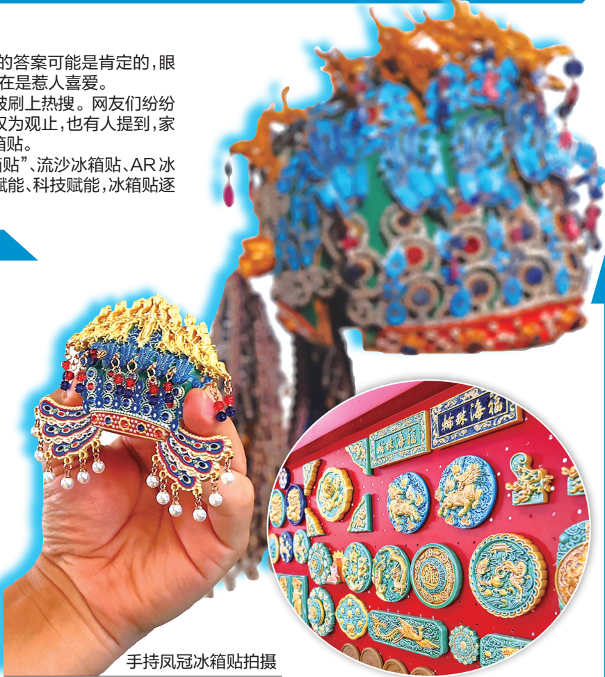
手持凤冠冰箱贴拍摄

此前发布的“全国文化中心建设2024年度十件大事”提到,“爆款文创”引领文博新潮流。2024年,文博文创迎来爆发式增长。国家博物馆的凤冠冰