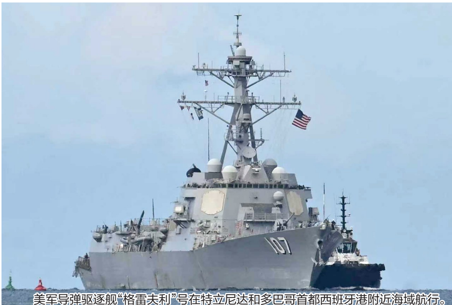
美军导弹驱逐舰“格雷夫利”号在特立尼达和多巴哥首都西班牙港附近海域航行。

近期,美国以缉毒为由在加勒比海域部署多艘军舰和兵力,包括“硫磺岛”号两栖攻击舰、“格雷夫利”号驱逐舰和海军陆