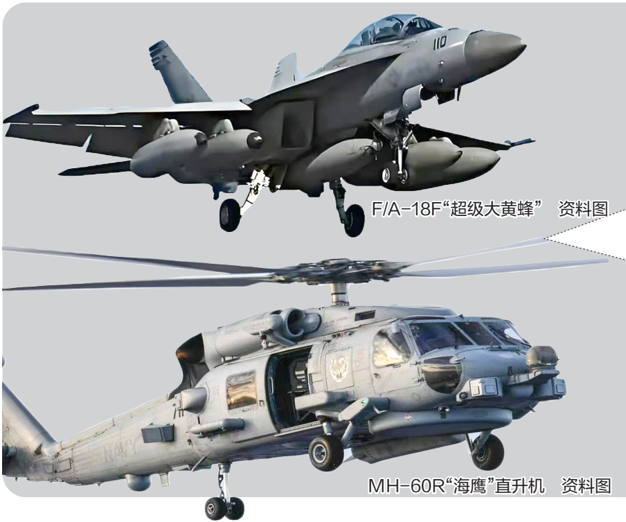
F/A-18F“超级大黄蜂” 资料图