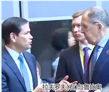
拉夫罗夫(右)与鲁比奥

几天之内,特朗普遭遇俄乌双重拒绝。显然,在俄乌坚持各自立场、没有成果保证的前提下,特朗普与普京若再次会晤,大概率会重蹈阿拉斯加峰会“空谈”覆