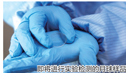
即将进行实验检测的月球样品