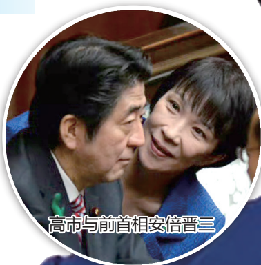
高市与前首相安倍晋三

高市有3次参加自民党总裁选举的经历。2021年首次参选未果;2024年与石破茂一起进入决胜轮;在本月初的选举中,她当选自民党总裁。