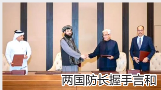
两国防长握手言和

11日深夜至12日凌晨，巴基斯坦与阿富汗在两国边境地区交火。阿方称，为回应巴基斯坦方面9日夜间接对阿首都喀布尔及帕克提卡省的空袭，阿富汗军队于11日夜间接发起报复性行动。巴方谴责“阿富汗在巴阿边境地区的挑衅行为”，要求阿方确保其领土不被用于针对巴基斯坦的恐怖活动。