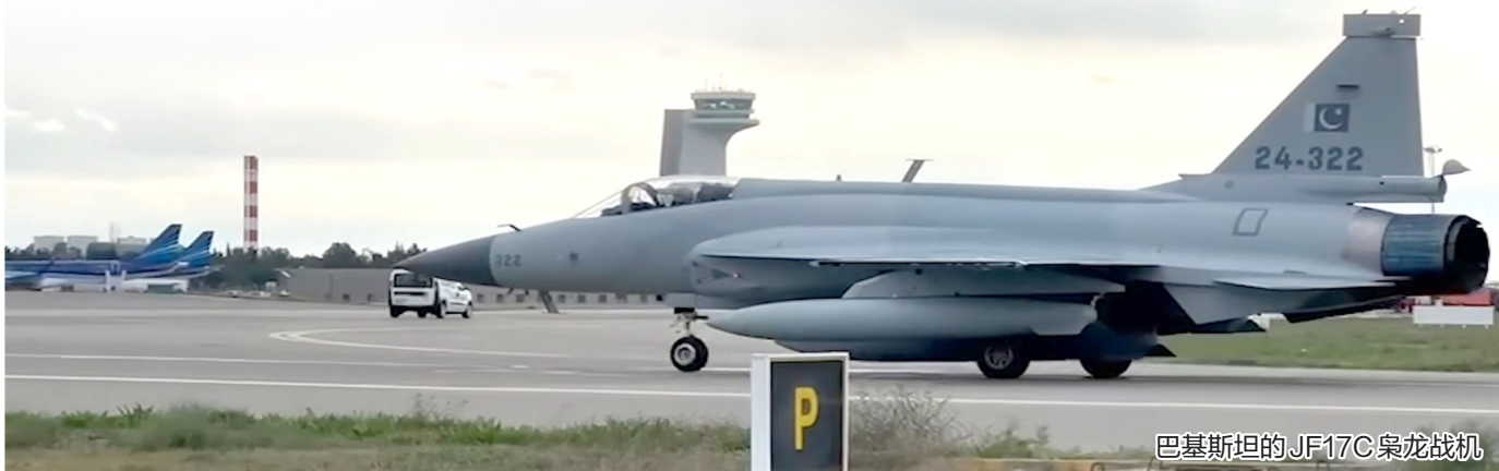
巴基斯坦的JF17C枭龙战机

巴基斯坦与阿富汗爆发边境冲突后，双方上周在卡塔尔举行谈判。两国政府官员19日分别证实，双方已达成停火协议。根据协议，双方重申致力于和平、相互尊重以及保持牢固和建设性的睦邻关系。两国还承诺通过对话解决争端，不得对彼此采取敌对行动。知情官员说，这次谈判长达13个小时，双方将于本周末在土耳其继续谈判，讨论如何落实协议。