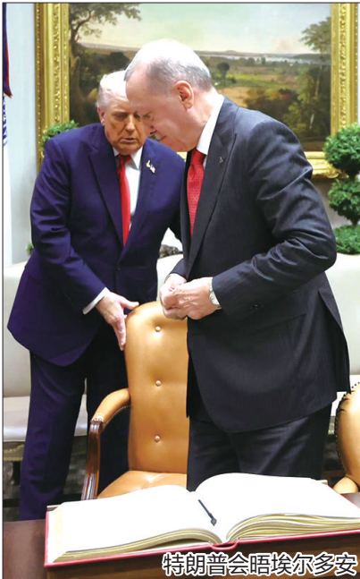
特朗普会晤埃尔多安