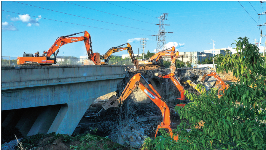
目前,荣乌高速烟台枢纽至蓬莱枢纽段改扩建项目正在快速推进,这条双向八车道的高速大动脉将为市民出行带来更多便利。

本报讯(YMG全媒体记者 杨春娜 摄影报道)9月16日上午9时,随着最后一段路面清洗完毕,荣乌高速烟台枢纽至蓬莱枢纽段改扩建项目历经24小时连续作业,完成最后一批12座跨线桥梁的拆除任务,成功打通项目建设的关键卡口,为后续工程全面提速奠定了坚实基础。 荣乌高速烟台枢纽至蓬莱枢纽段改扩建项目分3次集中拆除跨线桥梁40座。自启动以来,山东高速烟蓬项目公司坚持超前谋划、科学施策的原则,反复沟通对接交通主管部门,论证采用“全路段封闭、分批次拆除”的交通组织方案,从源头杜绝通行与施工相互交叉的安全隐患。拆除作业前,项目公司组织参建单位开展多轮次模拟推演,优化施工方案,提高作业效率和施工精度;拆除期间,党员突击队承担关键任务,昼夜驻点坚守,统筹调度共计366台大型设备和564名作业人员,克服了作业时间紧、安全管控难等诸多问题。