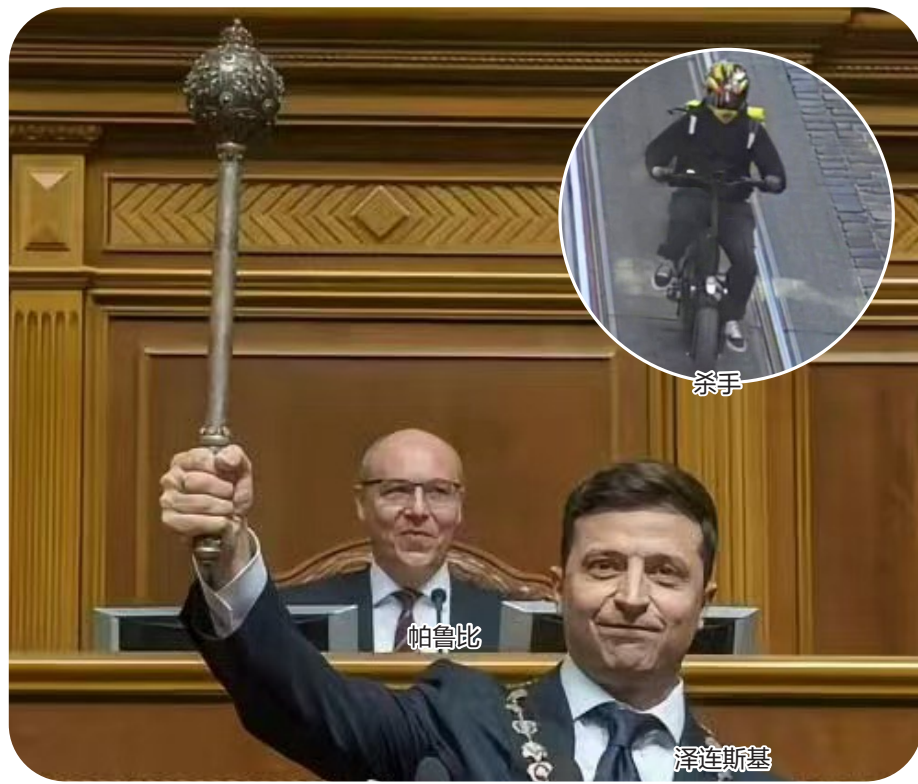
泽连斯基宣誓就职总统时，他身后那位就是当时的乌克兰最高拉达议长帕鲁比