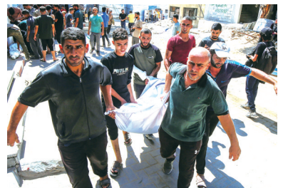
人们在加沙城搬运遇难者遗体