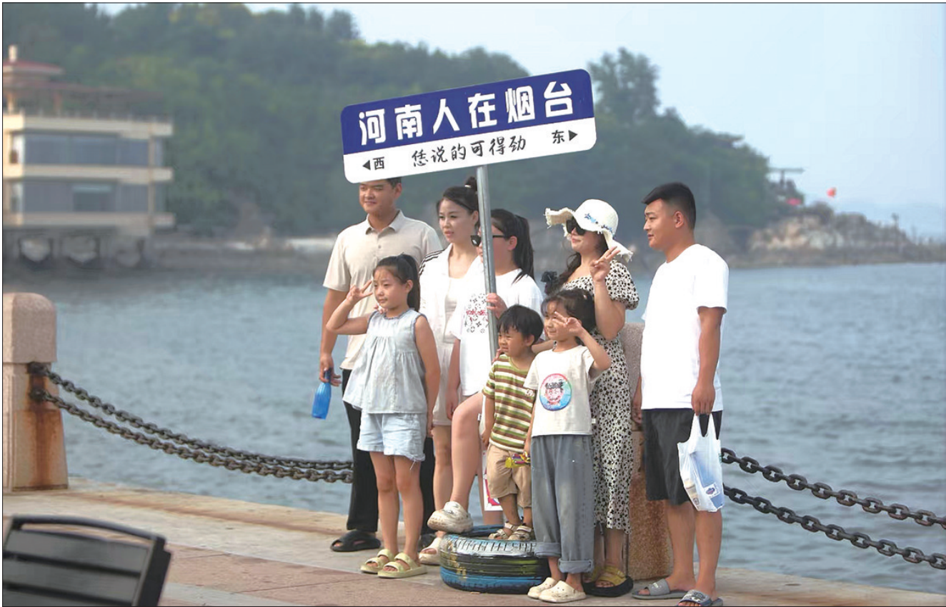
近日,外地游客在市区海岸路的“家”门前留影。我市近期迎来大批游客,海岸路也成为外地游客的打卡地。

28日夜间到29日白天,阴有雷雨或阵雨,北风短时南风,沿海及内陆3-4级,雷雨时阵风7-9级,23~32℃。29日夜间到30日白天,阴有中雨,局部大雨,伴有雷电,偏东风,沿海及内陆3-4级,雷雨时阵风7-9级,23~30℃。