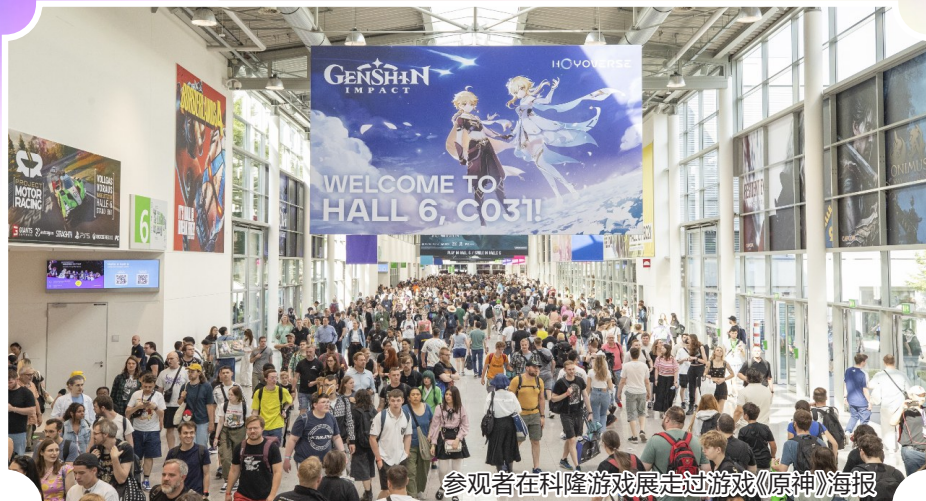
参观者在科隆游戏展走过游戏《原神》海报

2025年科隆国际游戏展20日至24日在德国科隆举办。在本次展会上，中国游戏展台分布比去年更广、规模更大、热度更高，多款新作试玩区前排起长龙。从内容日益丰富到影响力不断提升，从积极出海到深化中欧合作，中国游戏正以更加自信的姿态走向欧洲，迈向世界。