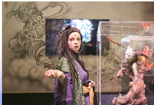
一名游戏角色扮演者在游戏科学展台与模型合影

今年是中国近代爱国政治家、民族英雄林则徐诞辰240周年。近年来，福州举行了一系列纪念林则徐活动。