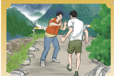
警报声响莫慌张,有序转移互帮忙。家里财物先不管,听从指挥勿擅返。