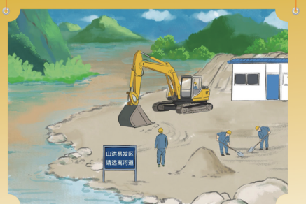
临时务工须警惕,安管勿选低洼地。山区施工更注意,防洪预案先备齐。