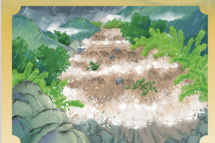
汛期暴雨易突下,洪水凶猛危害大。山洪点多范围广,突发频发很难防。

参与活动的美团外卖骑手纷纷表示,今后在送餐过程中会严格遵守交通规则,正确佩戴头盔,做到安全骑行、文明配送,确保每一次出行都能平安归来。