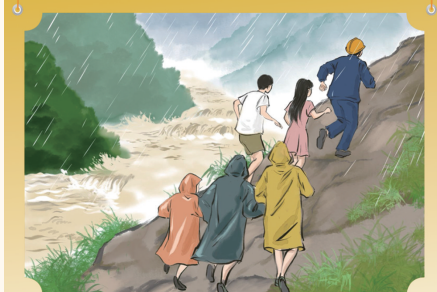
遭遇山洪别迟疑,河谷两侧高处避。意外落水心莫急,呼救抱树找高地。