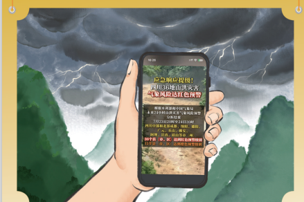
天气预报多关注,预警信号要牢记。进山旅游看天气,预报降雨早改期。