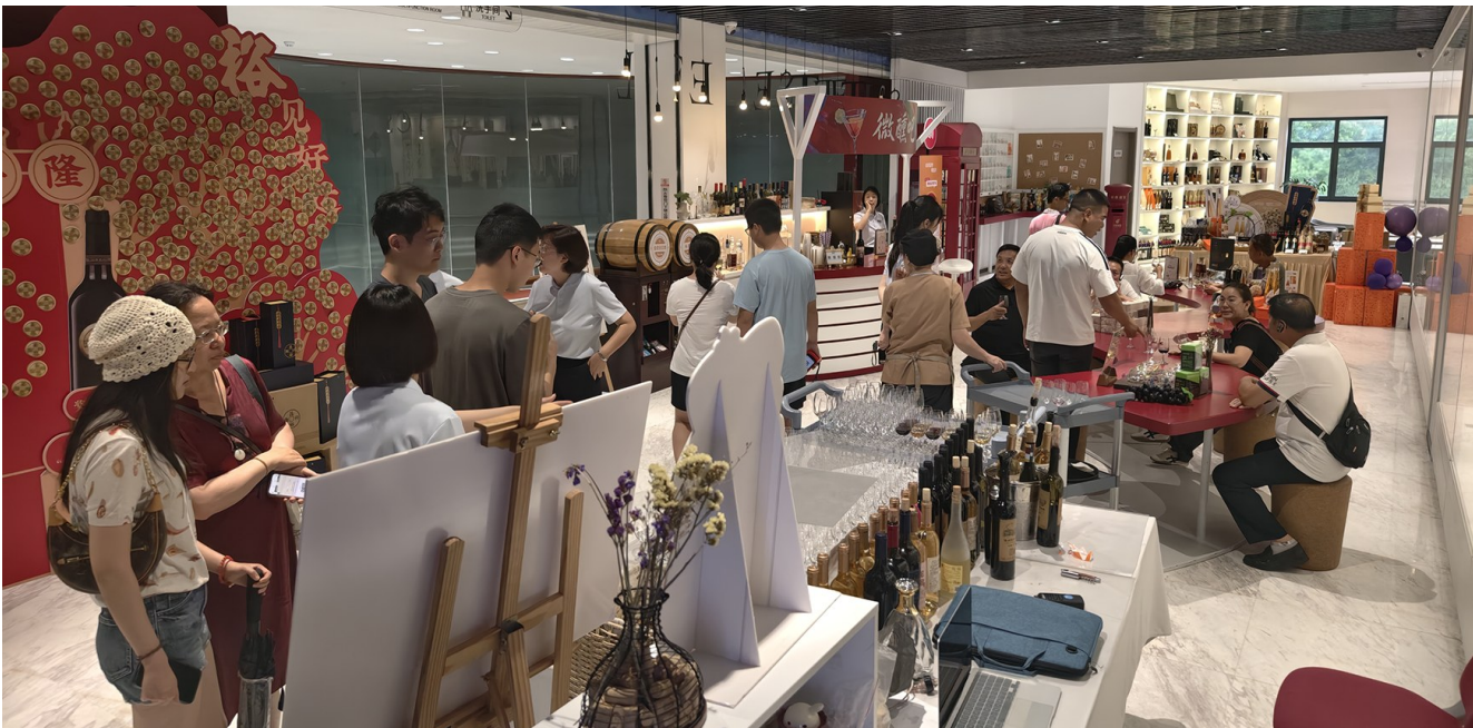
近日,在张裕酒文化博物馆内,游客们正聚精会神地聆听讲解员的讲解,从葡萄种植到酿造工艺,沉浸式感受中国葡萄酒文化的百年传承。随着文化旅游日益受到青睐,越来越多的游客选择走进博物馆,深度体验历史与文化的魅力。

7月31日夜间到8月1日白天,阴有中到大雨,局部暴雨,东到东南风,沿海及内陆4-5级阵风6级,24~32℃。