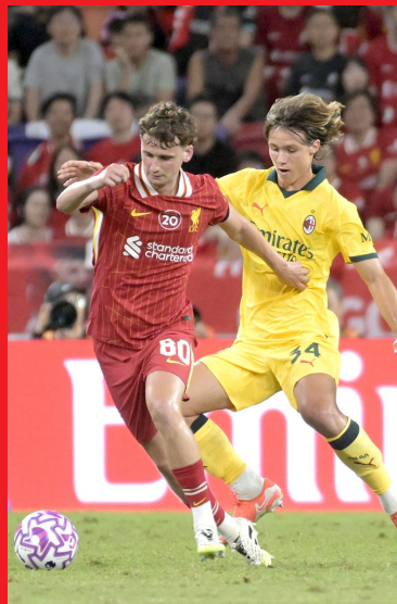
7月26日,利物浦球员莫顿(左)在比赛中进攻。