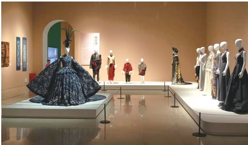
“中国非物质文化遗产传承人研修培训计划十年成果展”现场

施十年的经验成效,“中国非物质文化遗产传承人研修培训计划十年成果展”亮相中国非物质文化遗产馆。