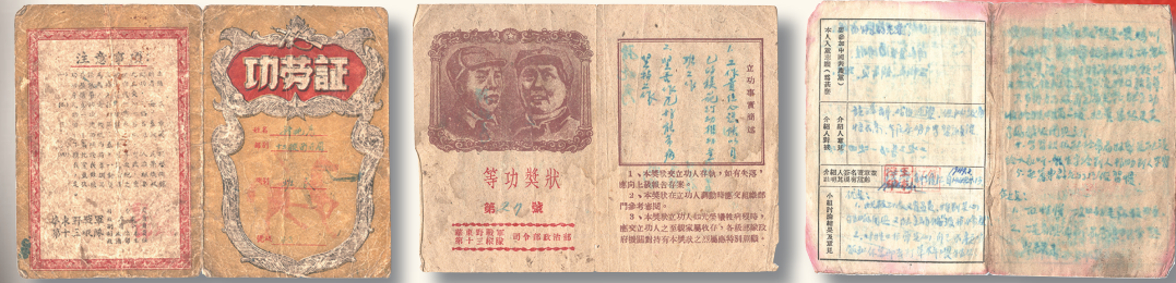
立功证书、入党志愿书