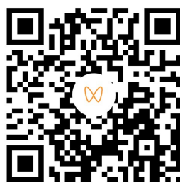
微信扫码观看视频