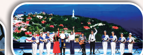
鼓乐《鼓乐声声唱烟台》