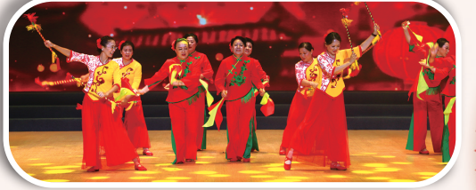
舞蹈《扬鞭舞板向未来》