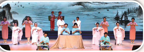
茶艺表演《茶香中国》