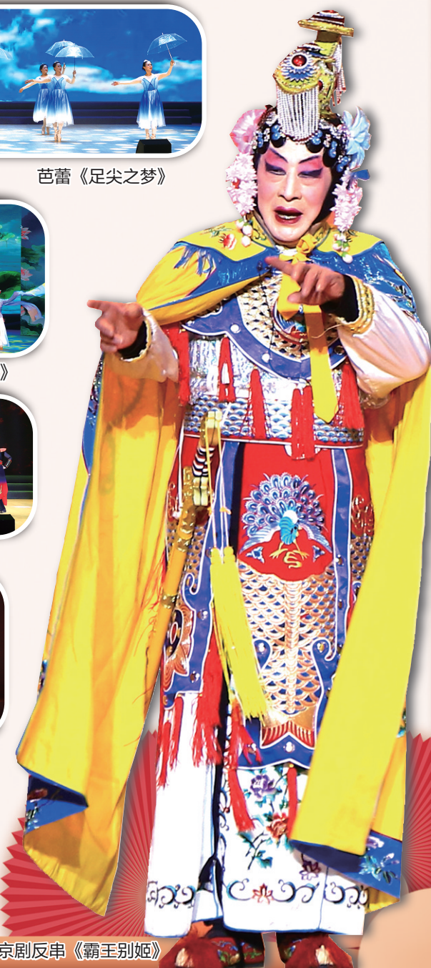
京剧反串《霸王别姬》