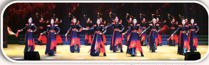
时尚秀《锐笔纵横走龙蛇》