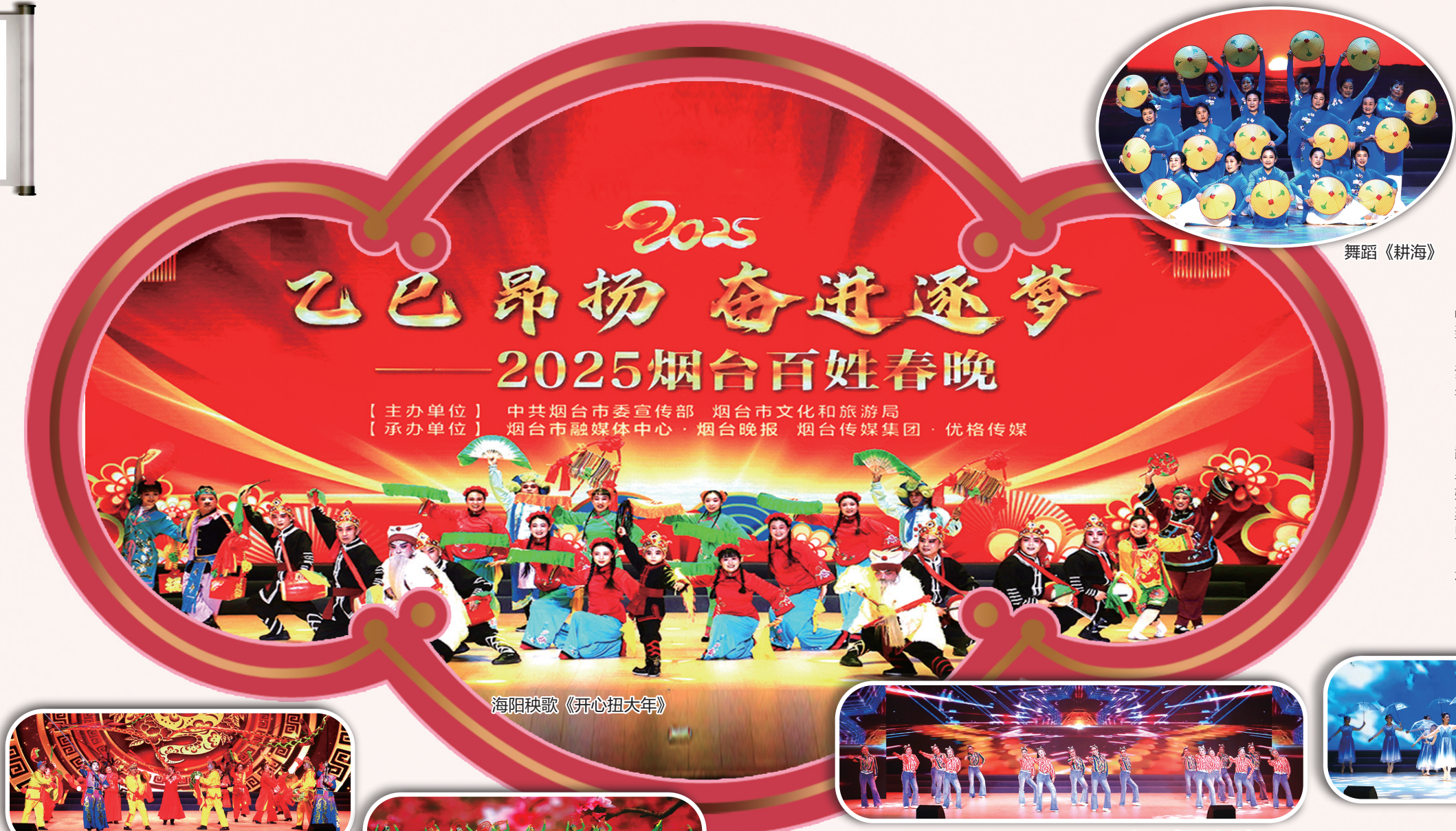
海阳秧歌《开心扭大年》