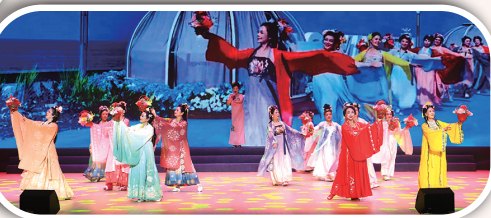
黄梅戏选段《天女散花》