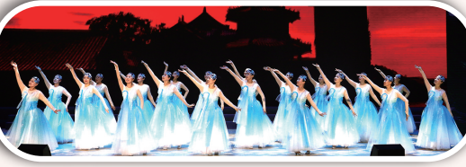
舞蹈《神仙生活蓬莱湾》