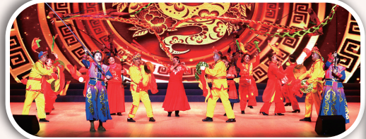
舞蹈《金蛇狂舞迎新春》