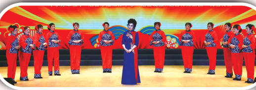
吕剧选段《李二嫂改嫁·借灯光我赶忙飞针走线》