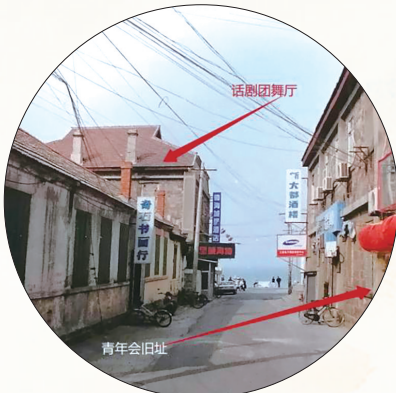
图为烟台广仁路旧址。

本书通过调查,深入记录了包括新希望、万控智造、迈瑞医疗、招商局集团、百果园等十余家头部企业的变革历程。这些企业遍布农业、制造业、服务业等多个领域,针对各自的产业特点,探索出了一条条具有特色的“数智化”路径和方法,具有重要的指导意义。