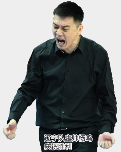
辽宁队主帅杨鸣 庆祝胜利

新华社长春4月6日电 2023-2024赛季中国男子篮球职业联赛(CBA)常规赛最后一轮10场比赛同时开打,辽宁、新疆、浙江、广东最终排名常规赛前四。