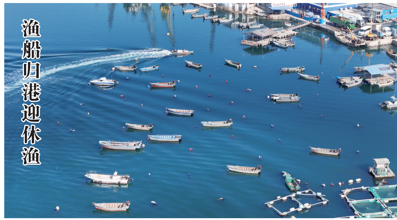
4月30日,在烟台市芝罘岛一处渔港,渔民们陆续驾驶渔船返港,准备休渔。5月1日12时起,我国渤海、黄海海域全面进入海洋伏季休渔期。

卸货、补给等任何便利,从源头锁死违规渔船出海通道。 严管渔获物流通。严格核验进口、养殖、冷冻水产品进销台账和来源凭证,对非法来源渔获物依法处置、倒查溯源、闭环管控,让非法捕捞所得“无处可销”,彻底切断违规利益链。 严管船舶修造。加强休渔渔船均修管理,严格落实审批报备制度,严禁维修未经批准私自上坞的休渔渔船,严厉打击“三无”船舶、假号套号船舶非法修造,铲除违规船舶滋生土壤。 严管海上执法。依托渔船信息化监管平台,综合运用日常巡查、交叉检查、突击抽查、区域联查等手段,对海上作业船舶“应登尽登”,对违法违规作为“露头就打”。 严管重点对象。对异地休渔、科研调查、专项捕捞等重点船舶实施差异化精准监管;加强对养殖渔船、休闲渔船等不休渔船舶的日常巡查,严防“挂羊头卖狗肉”式非法捕捞;适时组织封港清船行动,摸排清理涉渔“三无”船舶,溯源倒查船舶修造环节。 严管渔业安全。持续开展海洋渔业安全生产专项整治,推进“百港、千船、万人”提升行动,落实渔船安全风险分级管控和隐患排查治理,严控违规出海、非法捕捞等风险隐患,全力确保“平安伏休”。