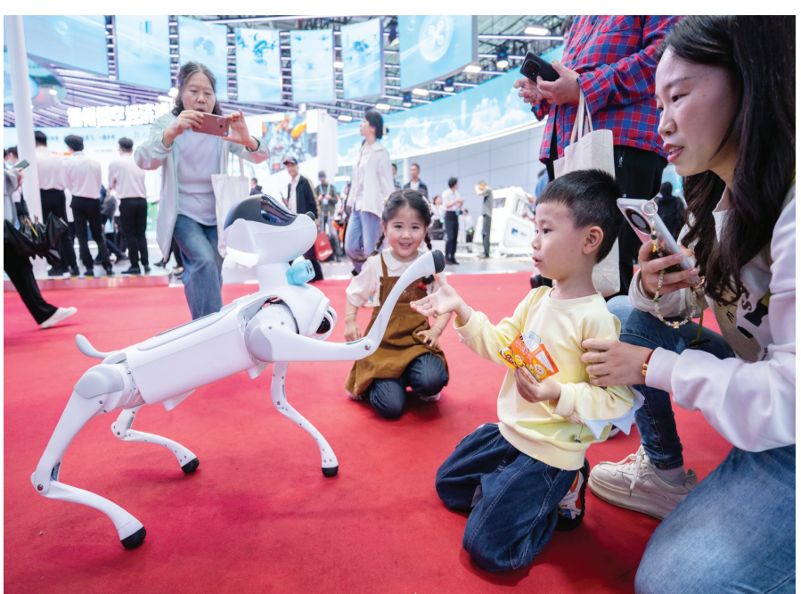
4月29日，小朋友在第九届数字中国建设峰会现场体验区与四足机器人互动。→