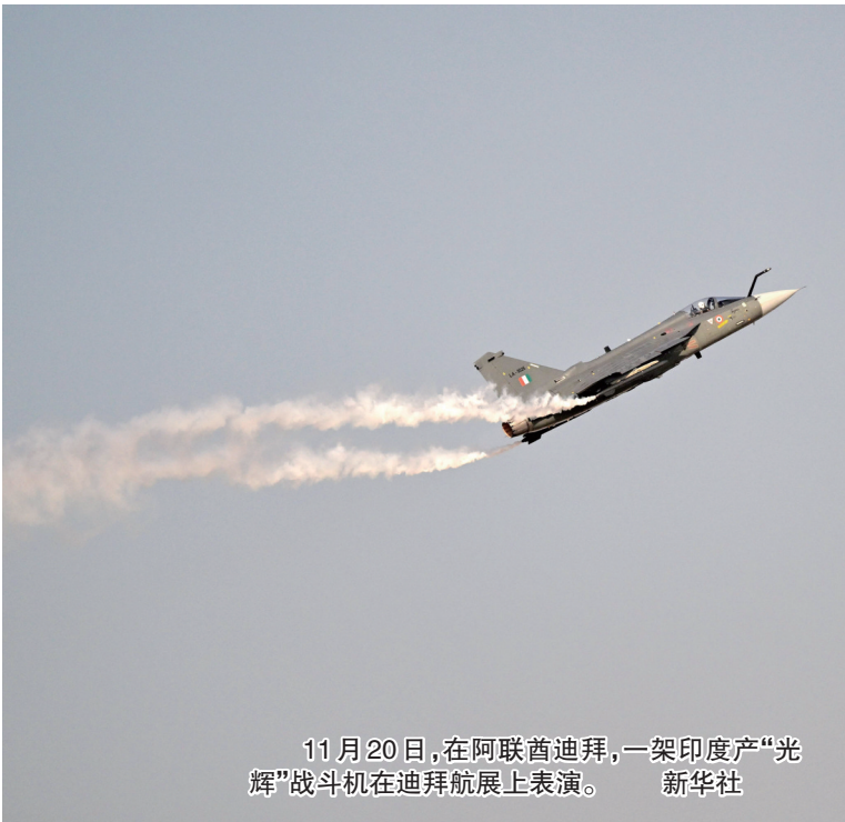
11月20日,在阿联酋迪拜,一架印度产“光辉”战斗机在迪拜航展上表演。

2025迪拜航展17日至21日举行。该航展是全球最大航展之一,每两年举办一次。本届航展吸引1500多家参展商,展出逾200架各型飞机。