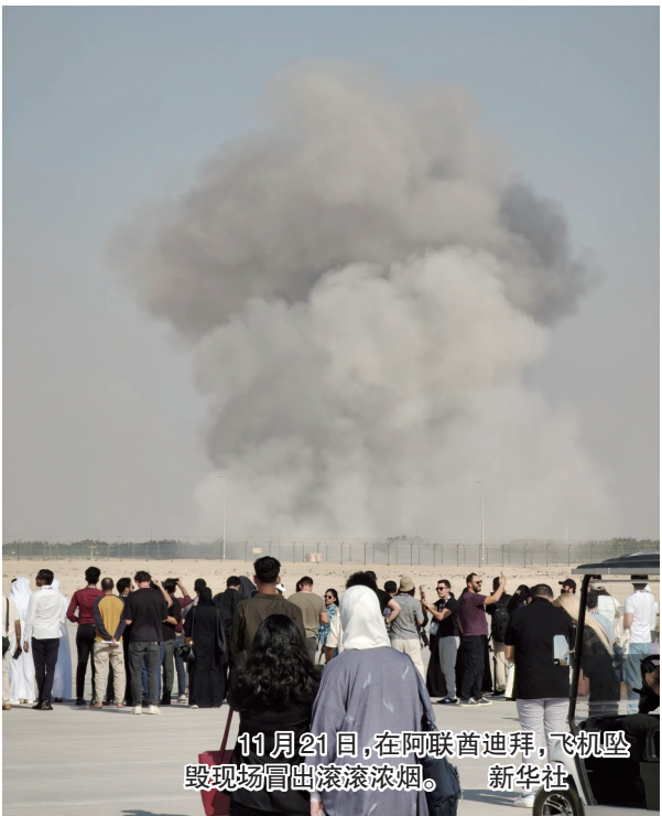
11月21日,在阿联酋迪拜,飞机坠毁现场冒出滚滚浓烟。