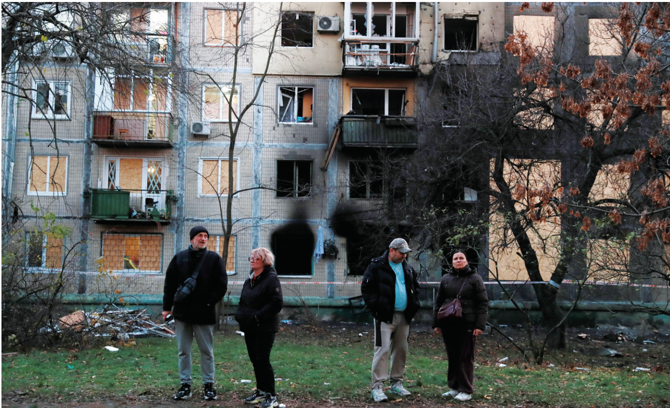
11月14日，在乌克兰首都基辅市第聂伯区，当地居民站在遭受空袭损毁的房屋前。

此外，阿克西奥斯新闻网站20日晚还披露了美方向乌方提交的另一份协议草案。草案显示，美国及其欧洲盟友承诺，未来将把针对乌克兰的任何“重大、蓄意和持续的武装攻击”视为对整个“跨大西洋共同体”的攻击，将予以包括使用武力在内的回应；为乌提供安全保障的初始期限为10年。草案包括乌克兰、美国、欧盟、北约和俄罗斯的签名栏。