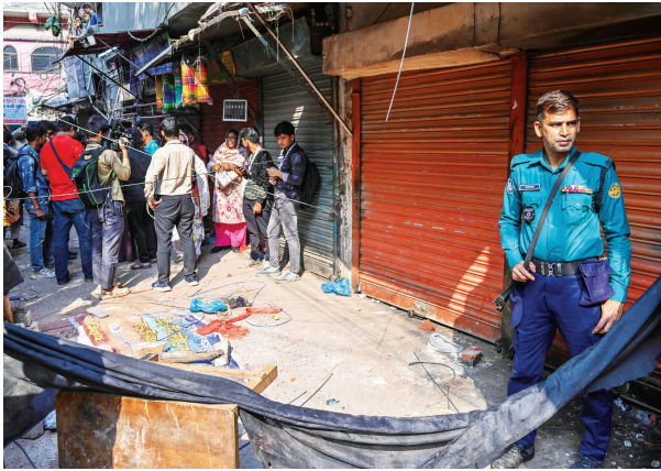
11月21日，在孟加拉国首都达卡，警方在一栋地震中受损的建筑旁警戒。据孟加拉国媒体报道，孟加拉国首都达卡附近21日上午发生5.7级地震，已造成至少6人死亡、数人受伤。

新闻稿称，现行制度下，移民通常在英国住满5年后即可在一定条件下获得永居。该政策覆盖通过经济类签证、家庭类途径和人道主义类途径入境的移民群体。