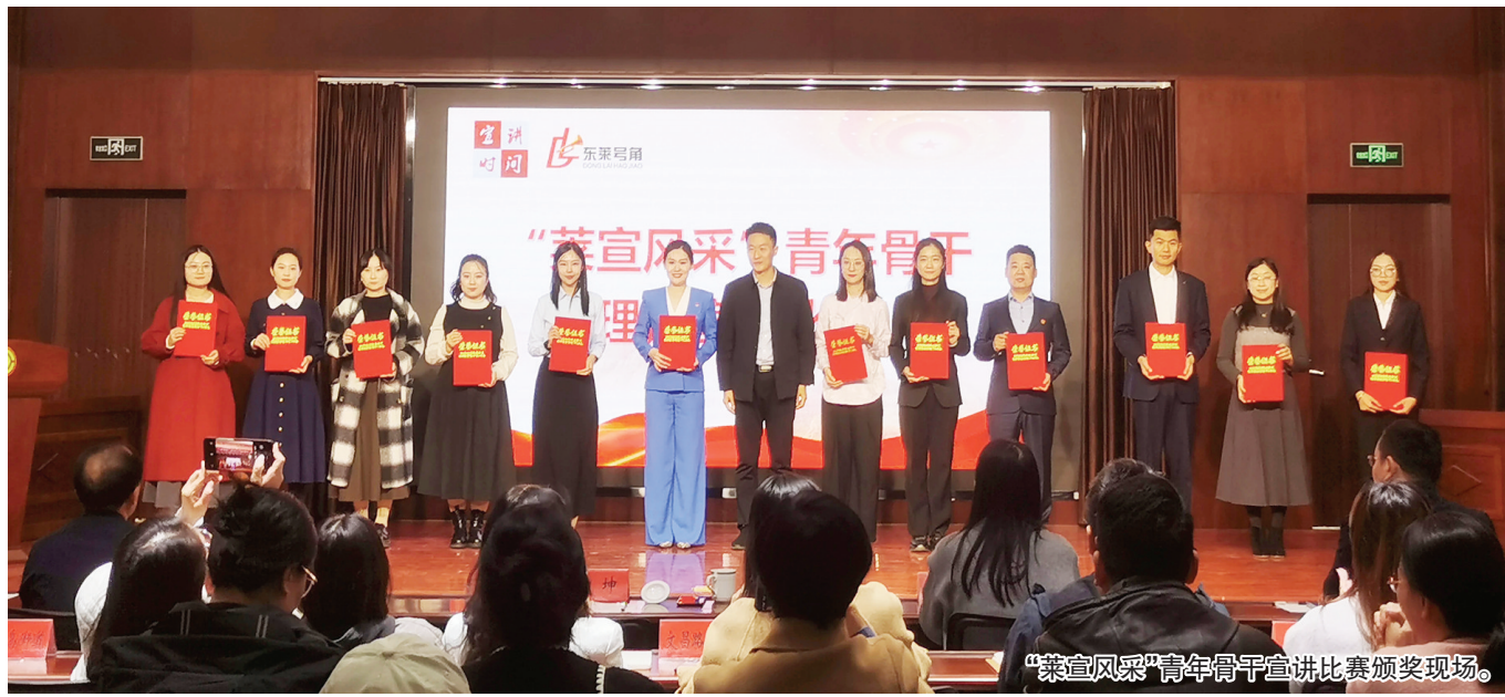
“莱宣风采”青年骨干宣讲比赛颁奖现场。

评委根据内容深度、表达张力、现场感染力等方面进行综合评定,比赛最终评选出一等奖2个、二等奖4个、三等奖6个。