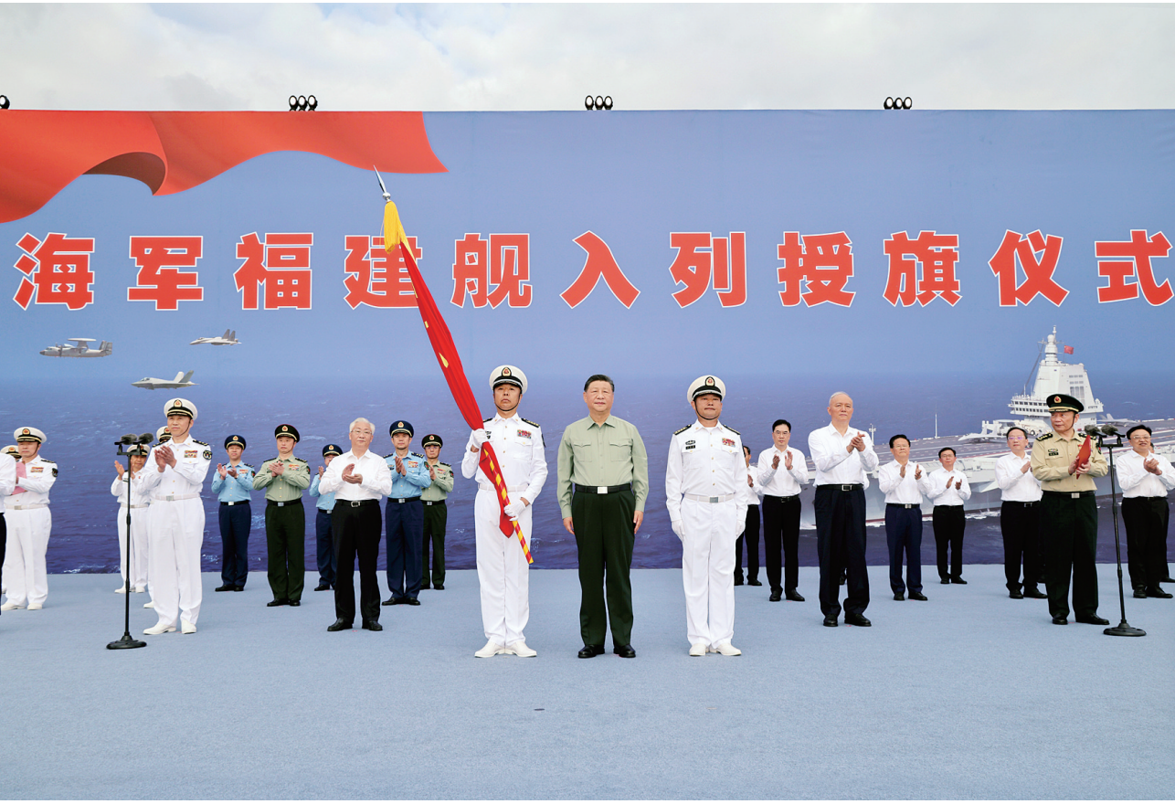
11月5日，我国第一艘电磁弹射型航空母舰福建舰入列授旗仪式在海南三亚某军港举行。中共中央总书记、国家主席、中央军委主席习近平出席入列授旗仪式并登舰视察。这是习近平向福建舰舰长、政治委员授予军旗。