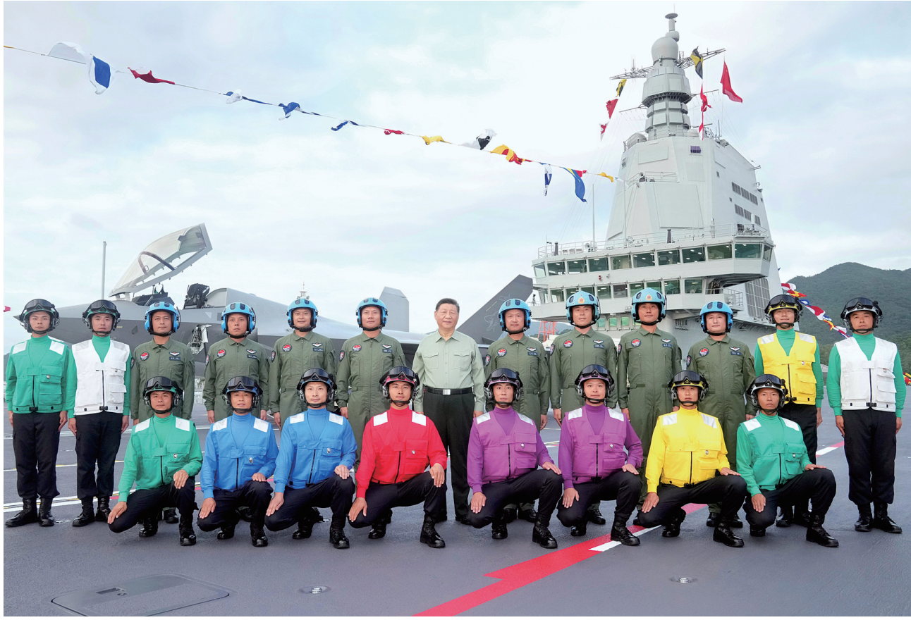
11月5日，我国第一艘电磁弹射型航空母舰福建舰入列授旗仪式在海南三亚某军港举行。中共中央总书记、国家主席、中央军委主席习近平出席入列授旗仪式并登舰视察。这是习近平同舰载机飞行员、航空保障人员合影留念。

新华社三亚11月7日电 我国第一艘电磁弹射型航空母舰福建舰入列授旗仪式5日在海南三亚某军港举行。中共中央总书记、国家主席、中央军委主席习近平出席入列授旗仪式并登舰视察。