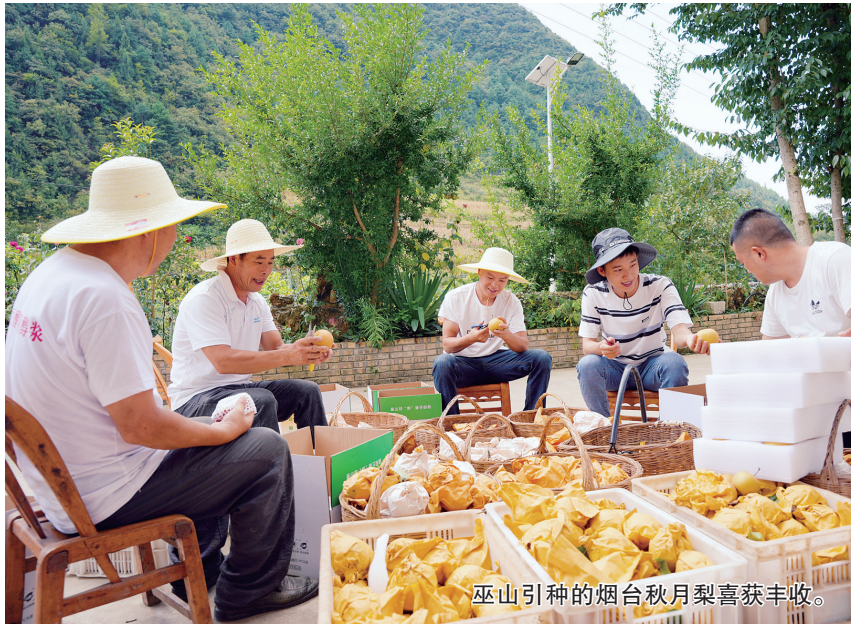
巫山引种的烟台秋月梨喜获丰收。

一个弯接一个弯,一座山接一座山,通往巫山县袁都村的盘山路,不止十八弯。就在这重重大山深处,一棵来自1600公里外山东烟台的秋月梨,扎下了根,结出了金果子,也结出了两地携手共富的深情厚谊。