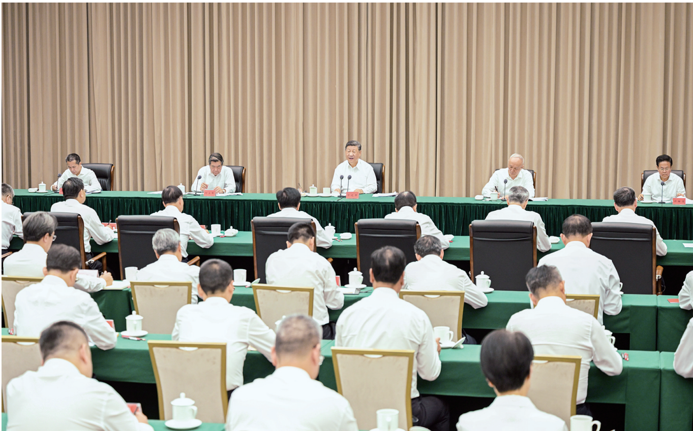
11月6日,中共中央总书记、国家主席、中央军委主席习近平在海南三亚听取海南自贸港建设工作汇报,发表了重要讲话。