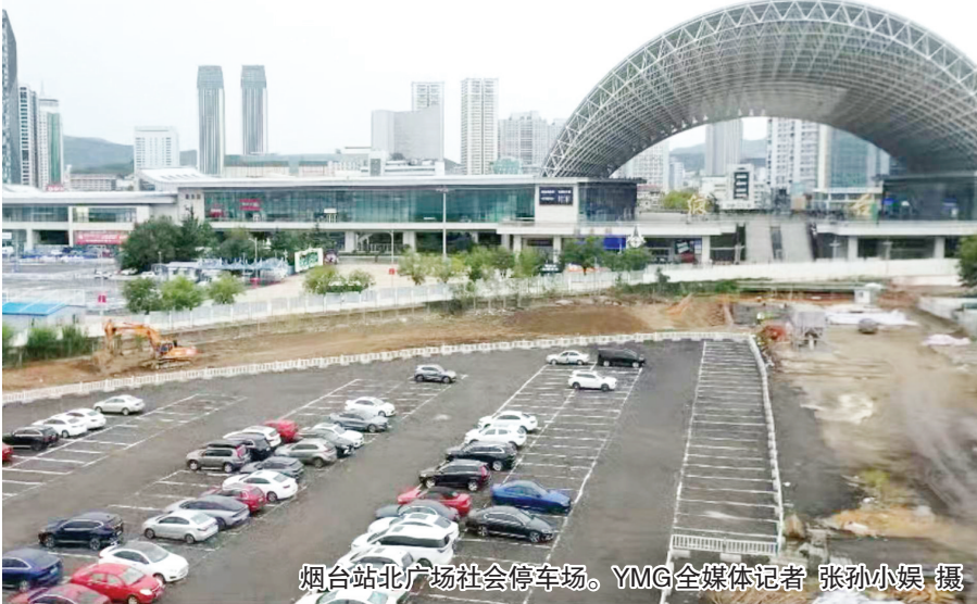
烟台站北广场社会停车场。

南广场落客通道出入口优化。将送客通道入口调整至北马路,送站的车辆可经北马路直接进站,无需绕行至海港路大转盘后再掉头进站,有效缓解了海港路交通压力。目前工程