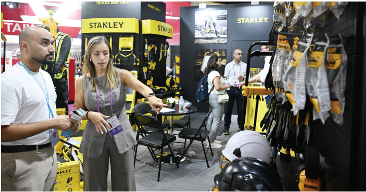
10月15日，在广交会进口展区，境外采购商(左)在美国公司史丹利展区参观。10月15日，第138届中国进出口商品交易会(广交会)在广州开幕。据了解，本届广交会展位总数7.46万个，参展企业超3.2万家，购创历史新高。本届广交会已有超24万名采购商预订展位，到会头部采购商企业预计超400家。