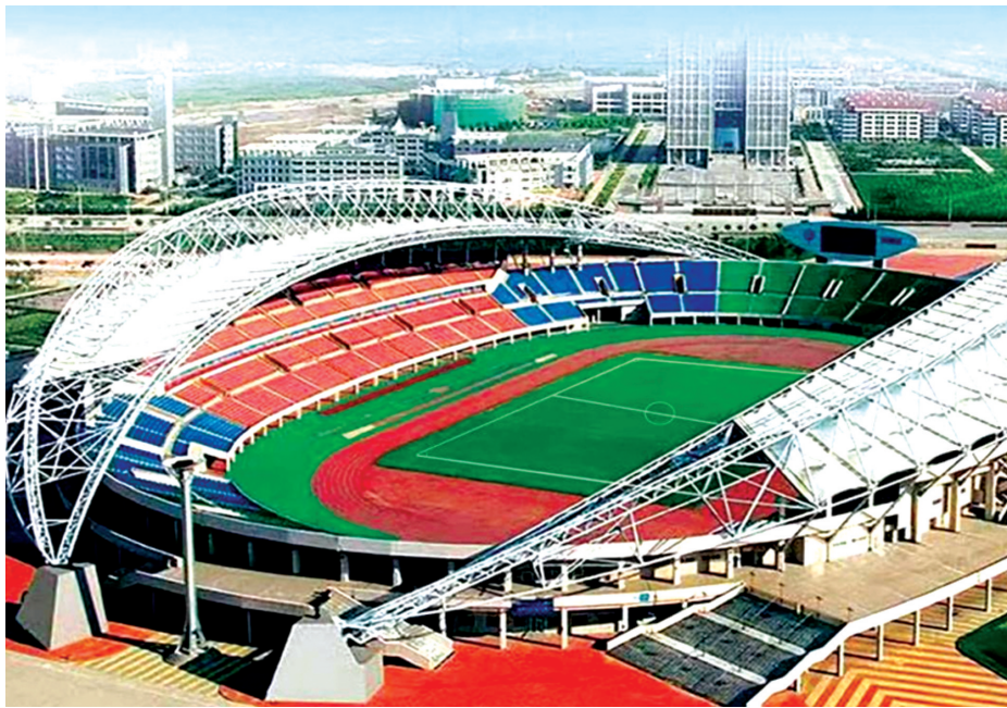
烟台体育公园体育场整装一新迎接“齐鲁超赛”。