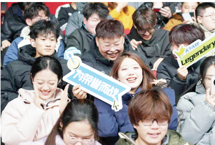
2024年烟台高新区大学生电子竞技大赛决赛现场观众席气氛热烈。(资料片)

从“校内选拔赛的初露锋芒”到“决赛时刻的巅峰对决”,从“王者荣耀的团队博弈”到“和平精英的战术博弈”,这场赛事将浓缩电竞运动的热血与荣耀。无论怀揣电竞梦想的选手,还是热爱观赛的粉丝,都能在这里见证“青春不设限、竞技无边界”的力量,让我们锁定赛事,一起期待港城电竞之耀,共同书写烟台电竞的全新篇章!