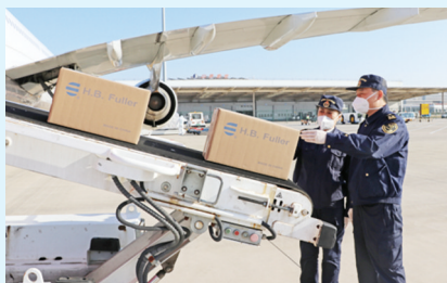
海关关员现场监管出口货物装运。(资料片)