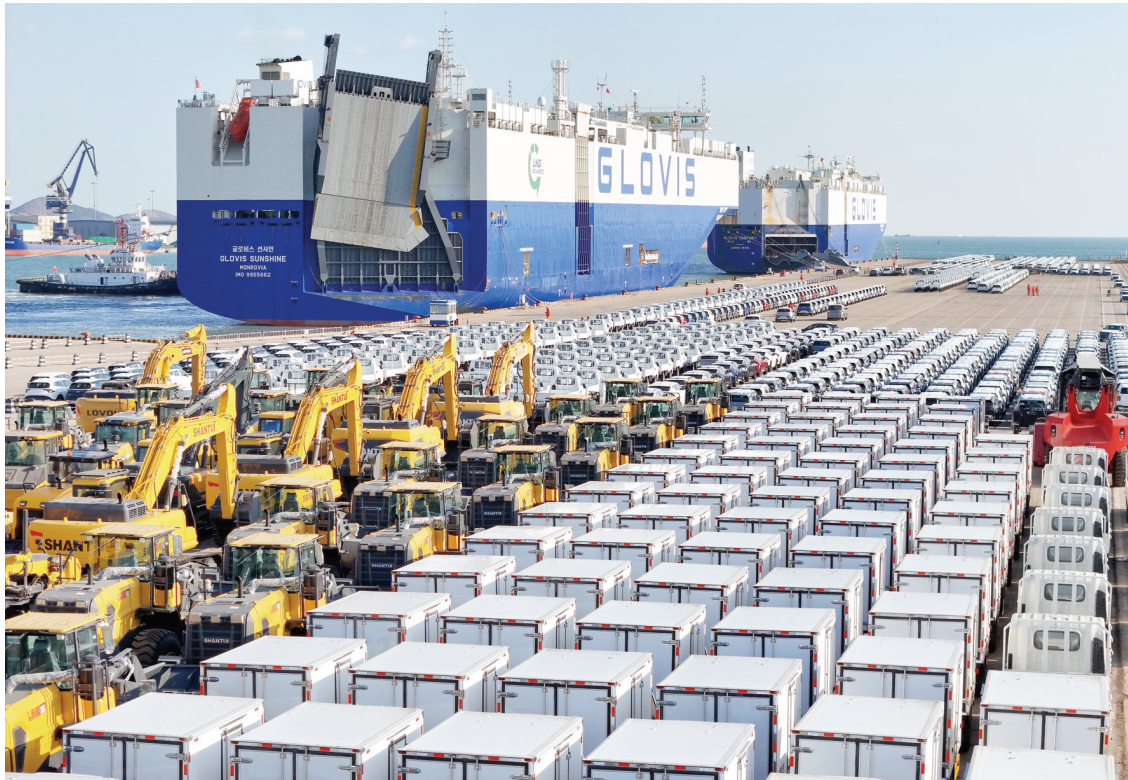
2025年1月2日,汽车运输船在山东港口烟台港装运出口汽车。(资料片)