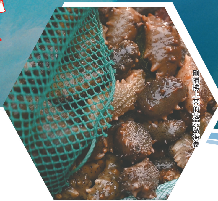
刚捕捞上来的芝罘岛海参