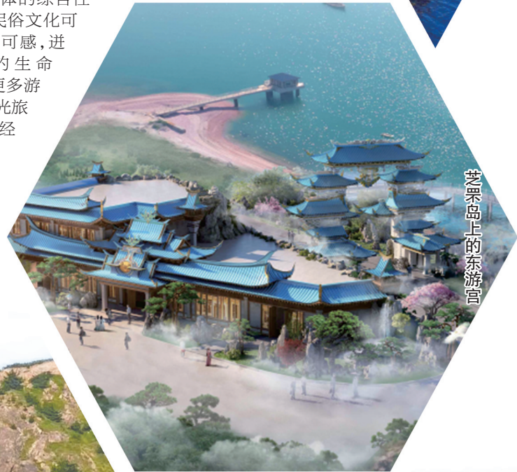
芝罘岛上的东游宫