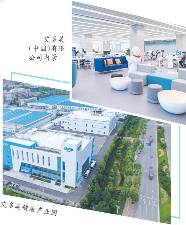
艾多美(中国)有限公司内景

近年来，烟台高新区锚定打造对外开放新高地目标，释放多重开放载体溢出效应，推动投资、贸易、园区迈向更高水平、更宽领域、更深层次开放。如今，这里现代化产业园鳞次栉比，跨境电商货物高效流转，国际合作项目有序推进，一幅双向开放、协同发展的画卷正徐徐铺展。