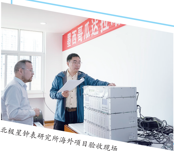
北极星钟表研究所海外项目验收现场

从黄海之滨到全球舞台，烟台高新区以开放为钥，解锁高质量发展新空间。未来，这里将继续深化制度型开放，拓展国际合作平台，培育更多具有全球竞争力的企业，让开放的春风吹遍每一个角落，绘就更加繁荣的发展图景。