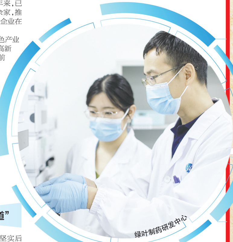
绿叶制药研发中心