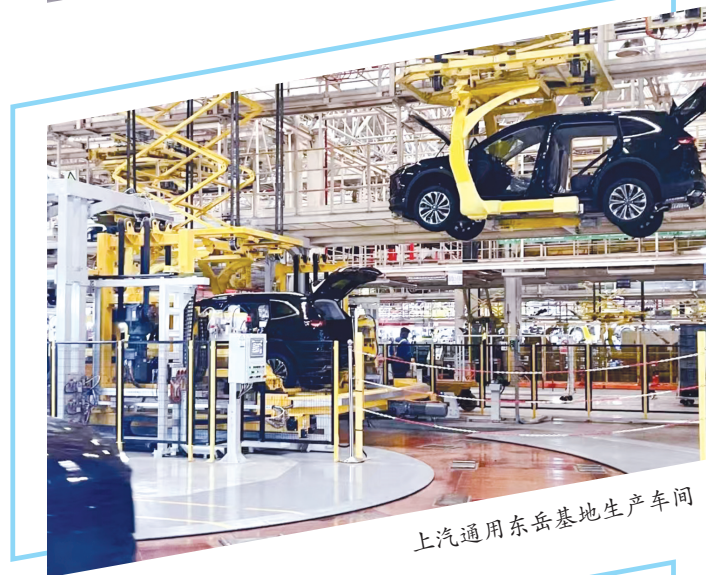
上汽通用东岳基地生产车间