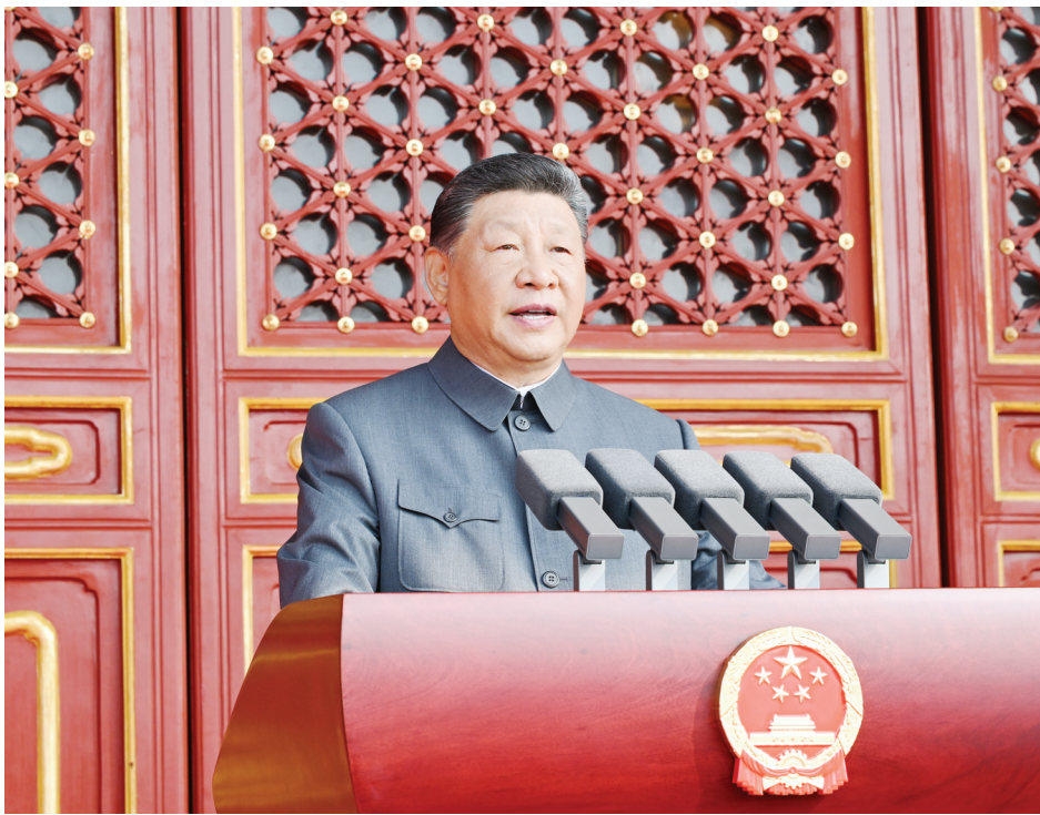
9月3日，纪念中国人民抗日战争暨世界反法西斯战争胜利80周年大会在北京天安门广场隆重举行。中共中央总书记、国家主席、中央军委主席习近平发表重要讲话。