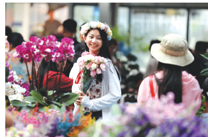
游客在昆明市斗南花卉交易市场一家花店内打卡拍照。

临近中国传统节日七夕节，云南鲜花在市场上格外走俏，尤其在各大电商平台，交易额不断刷新，“鲜花经济”持续火热。云南省商务厅统计显示，过去3年云南省鲜花交易规模的增量中，直播电商贡献占比近七成。