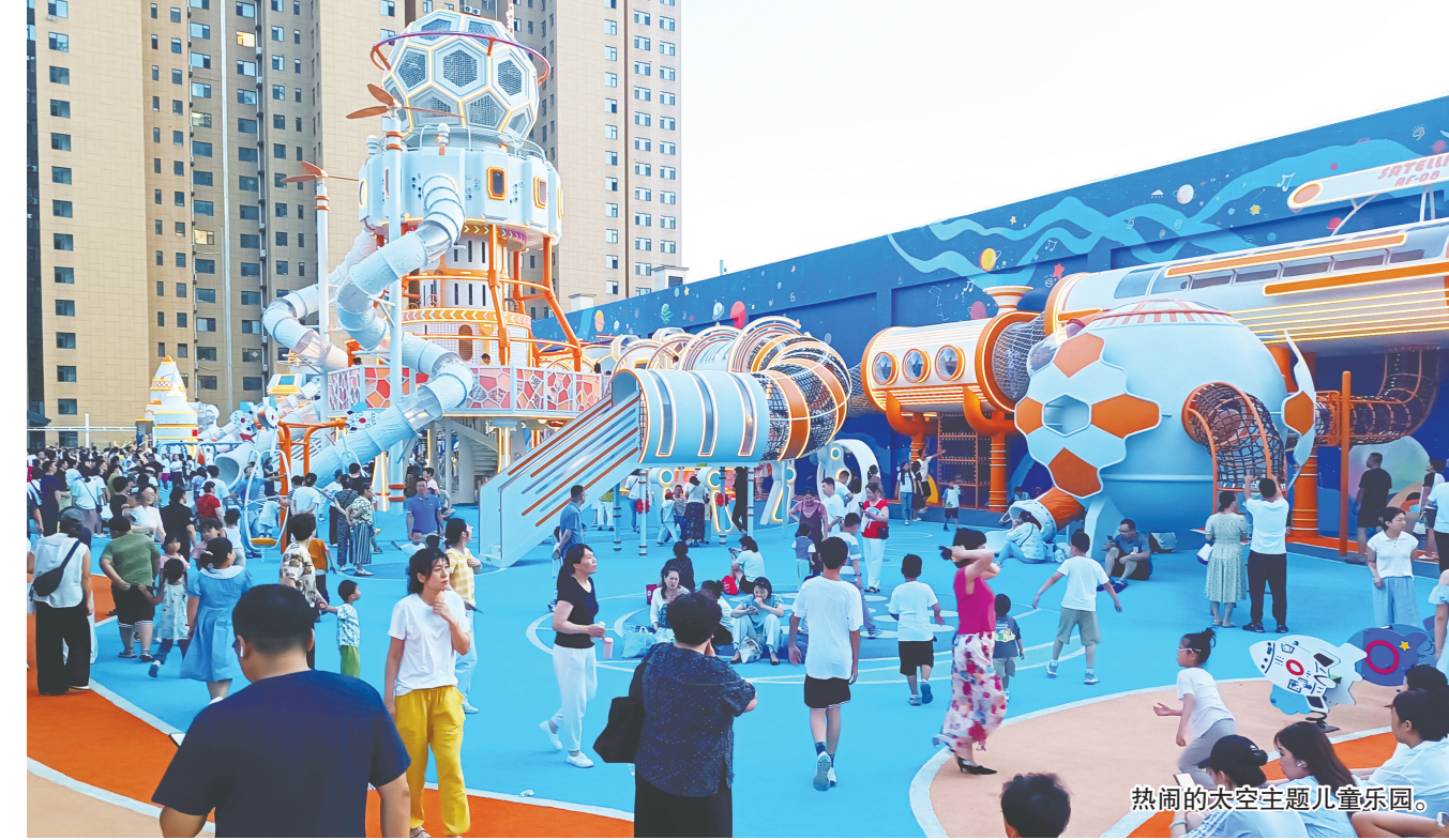
热闹的太空主题儿童乐园。

更值得关注的是,乐园带动了周边商业生态的升级转型。步行街通过“室内+户外”“购物+乐园”的业态组合,已形成完整消费闭环。数据显示,餐饮零售等配套