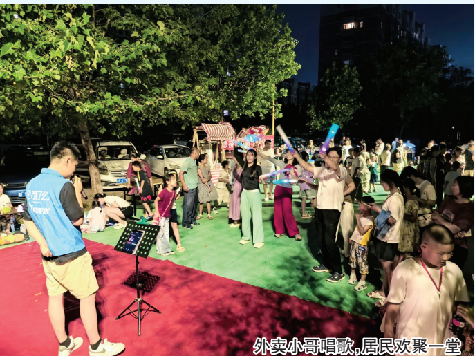
外卖小哥唱歌,居民欢聚一堂

理:免费理发让风尘仆仆的脸庞焕发精神,义务修车让奔波的交通工具重焕活力,这些看得见、摸得着的便利,让高温下的坚守多了一份感动。