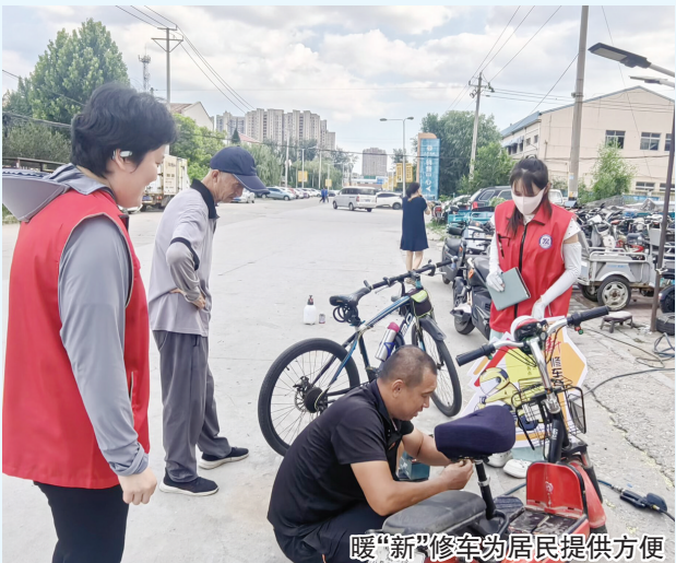
暖“新”修车为居民提供方便