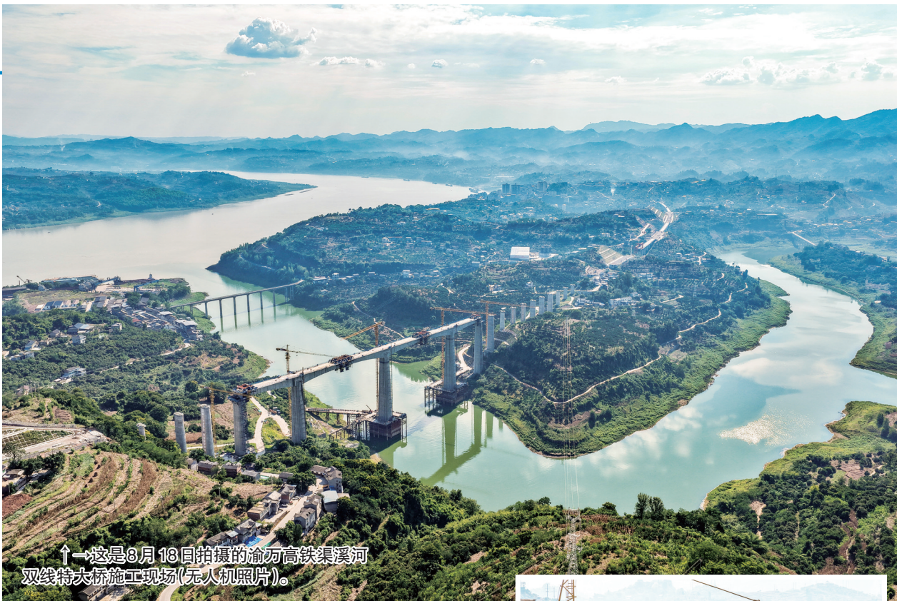
↑这是8月18日拍摄的渝万高铁渠溪河双线特大桥施工现场(无人机照片)。

700余名来自应急管理、公安、消防、自然资源、水利、卫生健康等部门的救援人员,携带着各种机械设备,沿着山洪沟道及下游周边展开地毯式搜救。新华社