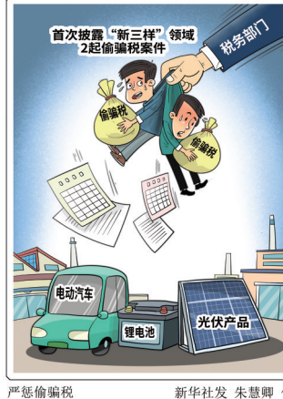
严惩偷骗税 朱慧卿 作

享受研发费用加计扣除税费优惠的企业,依法作出追缴税费、罚款的处理处罚决定,并依法加收滞纳金。另一起案件已经当地法院审理并作出判决,相关违法人员受到了法律的惩处。